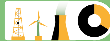
2010 verursachten Gebäude 32 Prozent des weltweiten Endenergieverbrauchs.