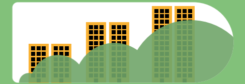
Bis 2050 könnten sich die CO 2 -Emissionen des Gebäudesektors verdoppeln oder verdreifachen.